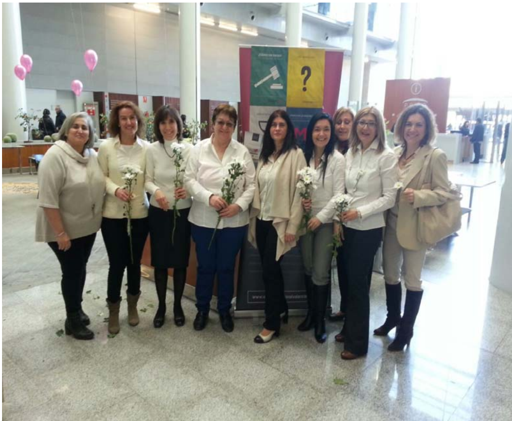
Actos en la Ciudad de la Justicia: Globos, explosión de blanco, margaritas... Otra forma de enfocar los conflictos.