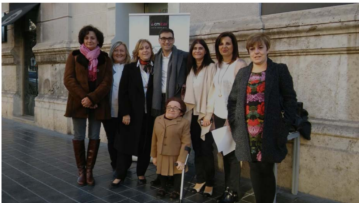
Jornada de Puertas Abiertas en el CMICAV.

Los actos celebrados este año, tanto en las dependencias de nuestro flamante Centro de Mediación como en la Ciudad de la Justicia, con motivo de esta efeméride, resultaron todo un éxito, consiguiendo que la Mediación vaya siendo conocida por los operadores jurídicos y por la ciudadanía en general. Os ofrecemos unas fotitos que resumen algunas de las actuaciones realizadas y muestran la ilusión colectiva con la que se ha afrontado este nuevo reto.